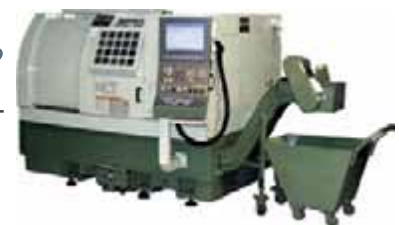
TNL100 NCT - Topper

☎ +38(048)738-07-35(36), 728-30-98 ✉ 65005, Одесса-05, а/я 98 E-mail: maleks@eurocom.od.ua