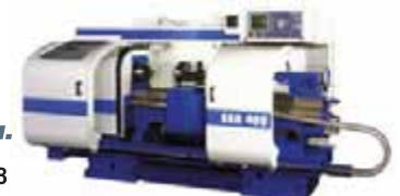
EEN 400 NCT