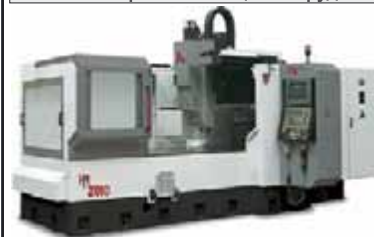
Фрезерные центры KONDIA NCT